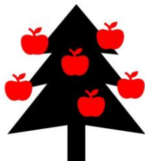
恒久基金寄付のイメージ図