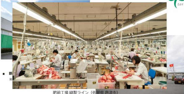
肥前工場 縫製ライン (佐賀県 唐津市) 北条工場 (鳥取県 北栄町)