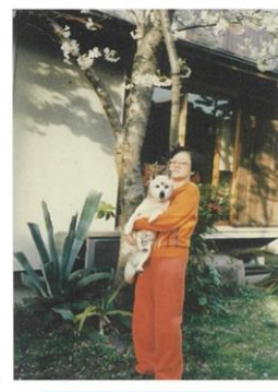
桜の木の下で抱っこしている