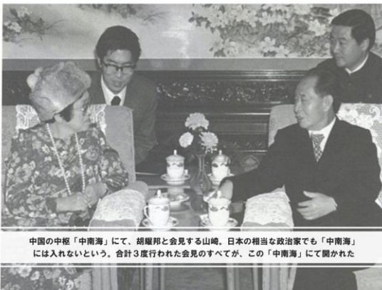
中国の中核「中南海」にて、胡耀邦と会見する山崎。日本の相当な政治家でも「中南海」には入れないという。合計3度行われた会見のすべてが、この「中南海」にて開かれた