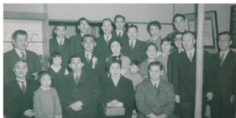
『暖簾』のモデルとなった実家の昆布屋「小倉屋山本」を高松宮岡妃岡殿下が訪れた際の1枚。前列左から三人目より高松宮殿下、同妃殿下。二列目右から四人目が山崎。