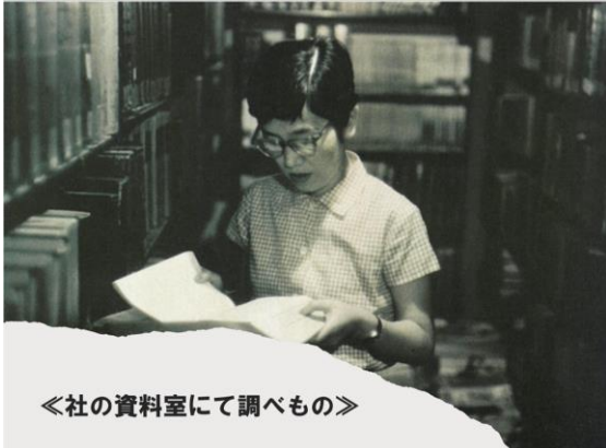
《社の資料室にて調べもの》