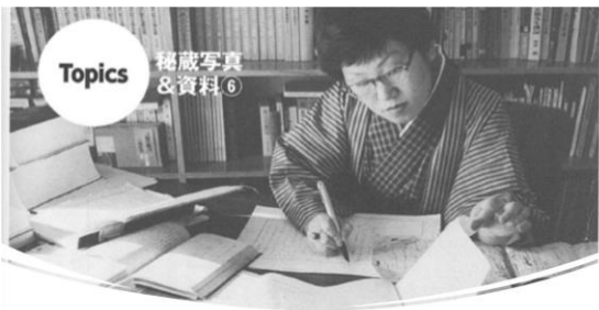
Topics 秘蔵写真 & 資料 ⑥