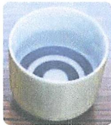
きき酒用の蛇の目のききちよこ

着色の程度と透明度を評価します。色が濃い場合は長期間貯蔵しているお酒と推定されます。蛇の目のききちよこ(写真)に描かれている青い同心円はそれらの判定を分かり易くするためです。